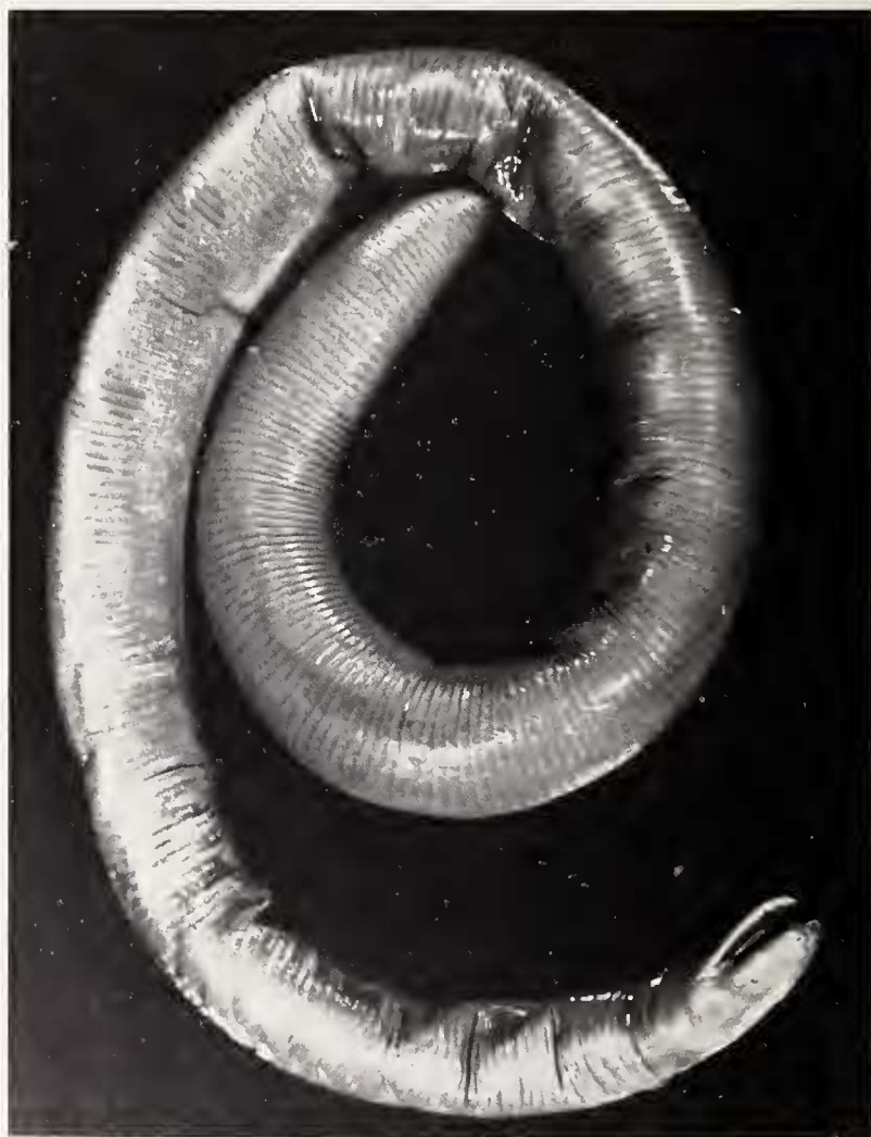
Fig. 1: Ichthyophis bernisi n. sp. Aspecto dorsal del holotipo.

Procediendo actualmente a la revisión y catalogación de la colección herpetológica del Museo Nacional de Ciencias Naturales del CSIC, hemos localizado un ejemplar del género Ichthyophis Fitzinger, 1826, que dada la rareza de estos animales en las colecciones hemos procedido a su examen y